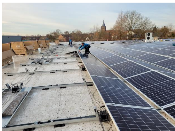
Zonnedak in aanleg