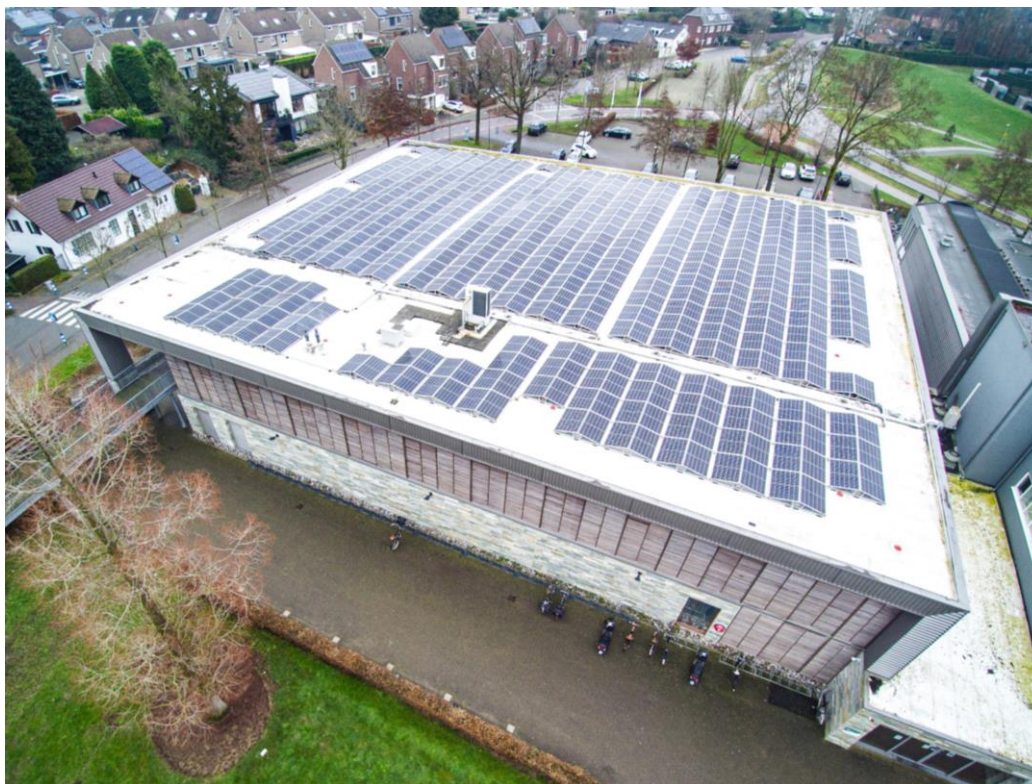
ZonneRoos-1-Herteheym in vogelvlucht.

Om alle leden en belanghebbenden de in gebruik name van ons eerste zonnedak project mee te laten vieren, werd op dinsdag 25 januari een online event georganiseerd onder de naam “Zonnig ZonneRoos”. Het feestcomité zorgde ervoor dat in de week voorafgaande aan het event bij alle aangemelde deelnemers een attentie werd afgegeven: een tas met duurzame en lokale streekproducten. De tas bevatte een fles vruchtensap, Limburgse keukskes, een appeltje voor de dorst, een zonnig peertje (geen gloeilamp ☺) en een klavertje vier voor geluk. De attentie werd duidelijk geapprecieerd. Het werd een gezellige en vrolijke avond. Er werd getoast voor het beeldscherm. De zonnig gele en duurzaam groene zijde van het meegeleverde Zonnig ZonneRoos kaartje werden gebruikt om aan te geven of men het eens of oneens was met de duurzaamheidsstellingen . Er werden toespraken gehouden, een fotocompilatie getoond, evenals opnames van interviews en van de onthulling van het bord bij Herteheym. En bij de dronebeelden voorzien van zonnige muziek, achter het beeldscherm meegedeind. Ook dankwoorden mochten natuurlijk niet ontbreken, zoals aan de Gemeente Roermond voor het beschikbaar gestelde dak, onze technisch adviseur Bert ten Haaf van Soltronergy, Installateurs Perlot en Willems en onze stroomafnemer All in Power.